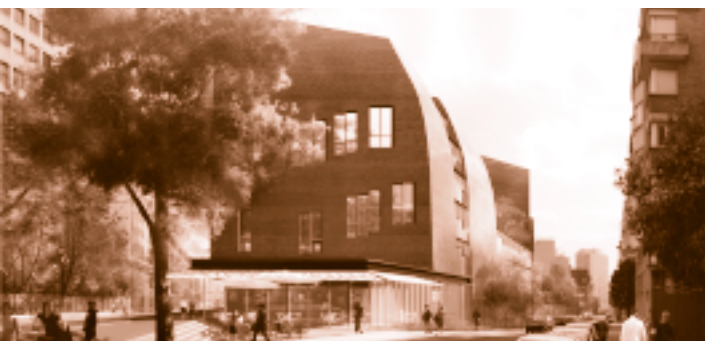
La BULAC se construit sur la ZAC Paris Rive Gauche entre la rue du Chevaleret, la rue Cantagrel et la nouvelle rue des Grands-Moulins.

En novembre 2001, les neuf établissements fondateurs du projet de Bibliothèque universitaire des langues et civilisations décident, sous la tutelle de la direction de l'Enseignement supérieur et de la direction de la Recherche (ministère de la Jeunesse, de l'Éducation nationale et de la Recherche), de la création d'un groupement d'intérêt public dont l'objet est « de préparer les collections, les services et l'installation de la Bibliothèque universitaire des langues et civilisations... » (convention constitutive, article 2). L'avis approuvant la création du GIP paraît au Journal officiel le 4 novembre 2003. La BULAC devient ainsi la première bibliothèque en France à fonctionner sous le régime du groupement d'intérêt public. •